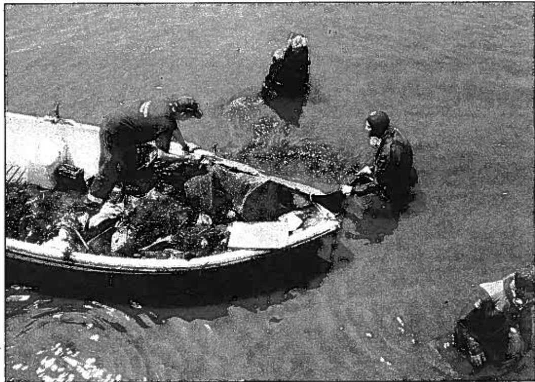
Nelle acque del porto di Pozzuoli (Napoli) sommozzatori bolzanini ripescano pesanti rifiuti d'ogni genere

ti a Pozzuoli, diversi abitanti ci hanno circondato minacciosi. Tanti ci chiedevano: «Che ce facite 'cca? Che vulite?». Pensavano che, venendo dai monti, non sapessimo nuotare. Poi però, abbiamo conquistato la loro fiducia e, alla fine delle operazioni, ci ha ringraziato addirittura Berlusconi». In quattro giorni di lavoro davvero sporco hanno raccolto venti tonnellate di immondizie, di tutti i generi: dai water alle batterie d'auto, dagli pneumatici all'esplosivo.