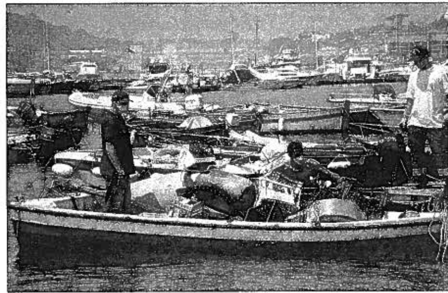
Il trasporto a riva con le mascherine, a bordo della barca prestata dai vecchi pescatori

Chiamati da Bertolaso hanno ripescato e campionato i rifiuti gettati nel porto vecchio di Pozzuoli